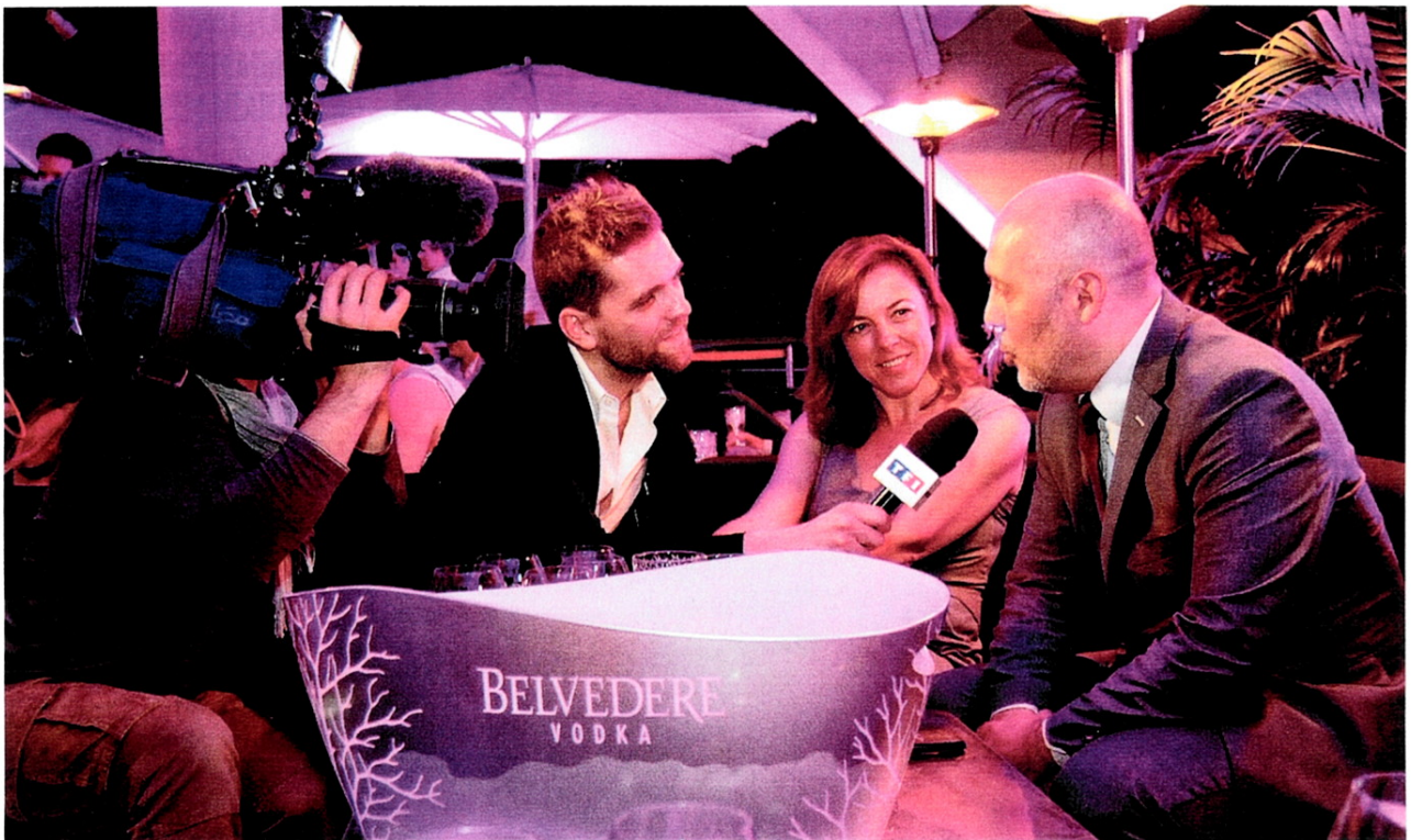
Radames Kili, glavna zvezda šou-programa 50 min inside u produkciji francuske televizije TF1 tokom 2012. godine

NEVEROVATNO JE KAKO NEKO MOŽE ODRŽAVATI FORMU BAVEĆI SE SOFT SPORTOM, KAO ŠTO JE ŠETNJA ILI VOŽNJA BICIKLA UMESTO VOŽNJE AUTA, ILI PENJANJE UZ STEPENICE UMESTO VOŽNJE LIFTOM